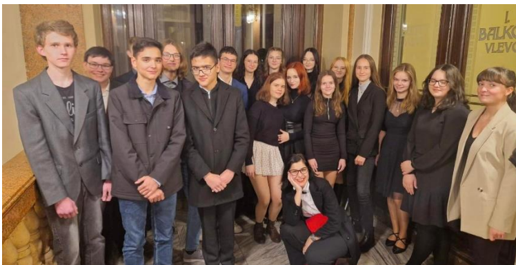
Návštěva představení Balada pro banditu (listopad 2022)