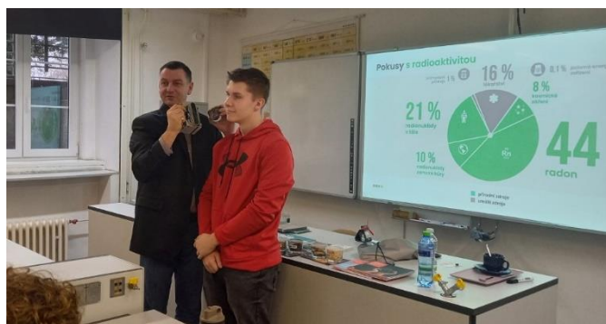
Přednáška „Energie – budoucnost lidstva“ (únor 2023)