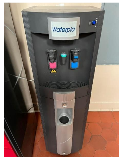
Dávkovač studené i teplé vody