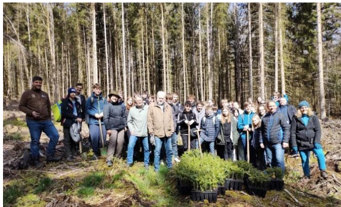
Projektový týden v Bavorsku ( Wunsiedel ) (duben 2023)