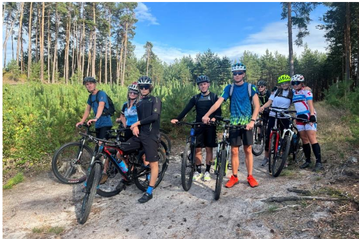
Cyklistický kurz sexty a 2. ročníku (září 2022)