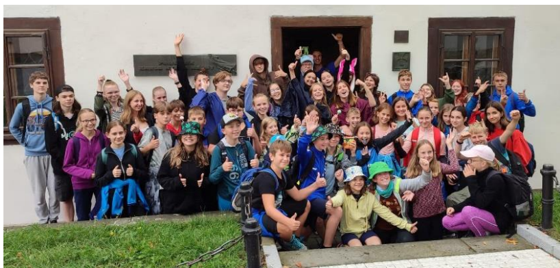
Primáci a prváci během seznamovacího kurzu v Doksech (září 2022)

Efektivitu práce metodika prevence zvyšuje rovněž realizace dotazníkových šetření. S budováním vztahů ve třídách nám výrazně pomáhá adaptační program určený nově nastupujícím žákům (prima a 1.A) a od roku 2018 pravidelně realizované teambuildingové programy, nově zajištěné Skautským institutem s programem SI třída (viz přehled aktivit ŠMP), který byl placen částečně z vlastních dotací institutu.