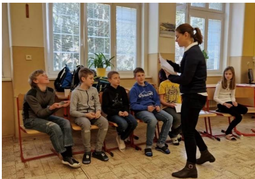
Školní psycholožka při práci v primě (2023)

V kariérním poradenství se práce výchovné poradkyně soustředila na pomoc s volbou seminářů a dalšího zaměření studia a pomoc s výběrem vysoké školy či administrativními úkony s tím spojenými nebo dalšího pracovního uplatnění pro maturanty. Při práci byly užívány speciální dotazníky, rozhovor i osobní znalost jednotlivých žáků a jejich dovedností a preferencí.