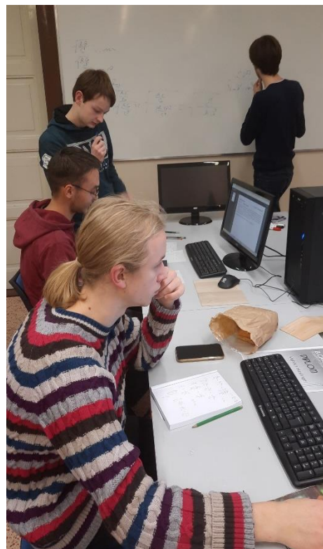
Studenti maturitních ročníků při programování (listopad 2022)

V říjnu se vyučující zúčastnili školení „Roboseminář pro SŠ“ a „Roadshow pro střední školy 2022“. Dále se kolegové absolvovali „Zimní školu digitální gramotnosti“ a konference „Inovace ve výuce“ v březnu. Celoročně pak schůzek metodického kabinetu v rámci okresu Litoměřice.