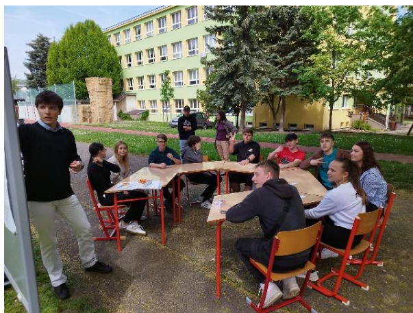
Výuka francouzštiny v rámci Dne frankofonie (11.5.2023)

Francouzský jazyk je na naší škole vyučován jako druhý cizí jazyk, povinně volitelný od tercie (pro osmileté studium) nebo 1. ročníku pro čtyřleté studium ve všech ročnících s 3 hod. týdenní dotací. V rámci volitelných předmětů je nabízena jednoletá Francouzská konverzace (2 hod./týden) a dvouleté Základy francouzského jazyka (2 hod./týden). V uplynulém školním roce bylo otevřeno 7 jazykových skupin francouzštiny + francouzská konverzace. Výuka probíhala primárně v učebně francouzského jazyka vybavené technikou, edukativními nástěnnými mapami a slovníky. Povinnými učebnicemi byly nadále On y va 1 pro tercii a kvartu a sada učebnice ÉDITO pro vyšší stupeň. Výuku zabezpečovali tři vyučující, z nichž byl jeden externista.