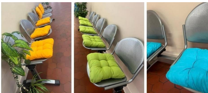
Vkusné barevné polštářky k sezení na chodbě

Záměrem školy je také budovat relaxační místa odpočinku pro žáky, proto došlo v minulých letech k vybavení tříd pohovkami a zútulnění chodeb barevnými polštářky k sezení. Novinkou v uplynulém školním roce jsou dávkovače vody s volbou studené, minerální nebo horké, díky kterým si žáci mohou připravit teplý nápoj nebo polévku.